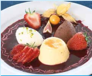
Sugar and Sweeteners

Planung, Errichtung, Bau und Modernisierung von kompletten Prozessstufen in Zuckerfabriken und -raffinerien, Engineering, Assistance, Maschinen und Ausrüstungen: