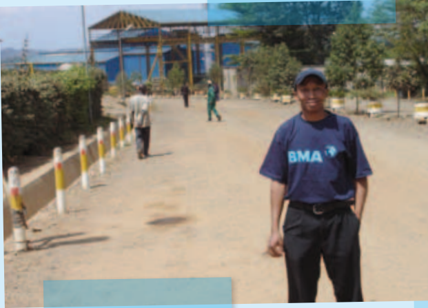
... in Kenia