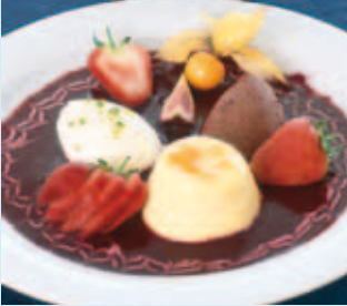
Sugar and Sweeteners

Etude, installation, construction et réhabilitation d'étapes de processus entières dans des sucreries et raffineries de sucre, ingénierie, assistance, machines et équipements : Installations de diffusion, diffuseurs, presses à pulpes, sécheurs à vapeur à lit fluidisé, évaporateurs, cristallisation continue et discontinue, centrifugeuses continues et discontinues, installations de séchage et de refroidissement de sucre, pompes, équipements et prestations de service pour la production de glucose cristallin, dextrose, fructose